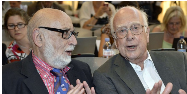
De gauche à droite, François Englert et Peter Higgs, lauréats du Nobel de physique 2013.