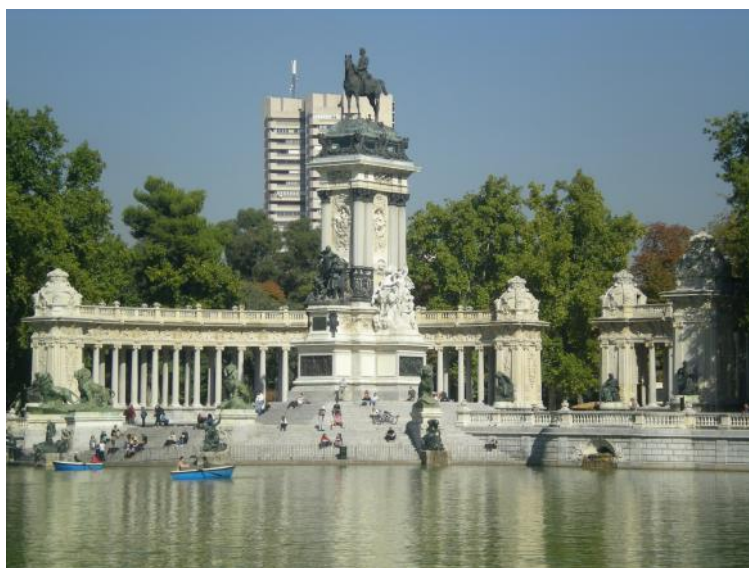
Parc du Retiro

Soleil, chaleur, marche à pied, découvertes culturelles et historiques, fous rires et bons moments, tel fut le voyage à Madrid du mois d'Octobre. Un programme riche et intense: visites de monuments, spectacle, musées, promenades en ville, dégustation de spécialités... Nous sommes tous rentrés enchantés de notre voyage, tant par le contenu que par le groupe dont nous faisons partie. Une expérience à renouveler!