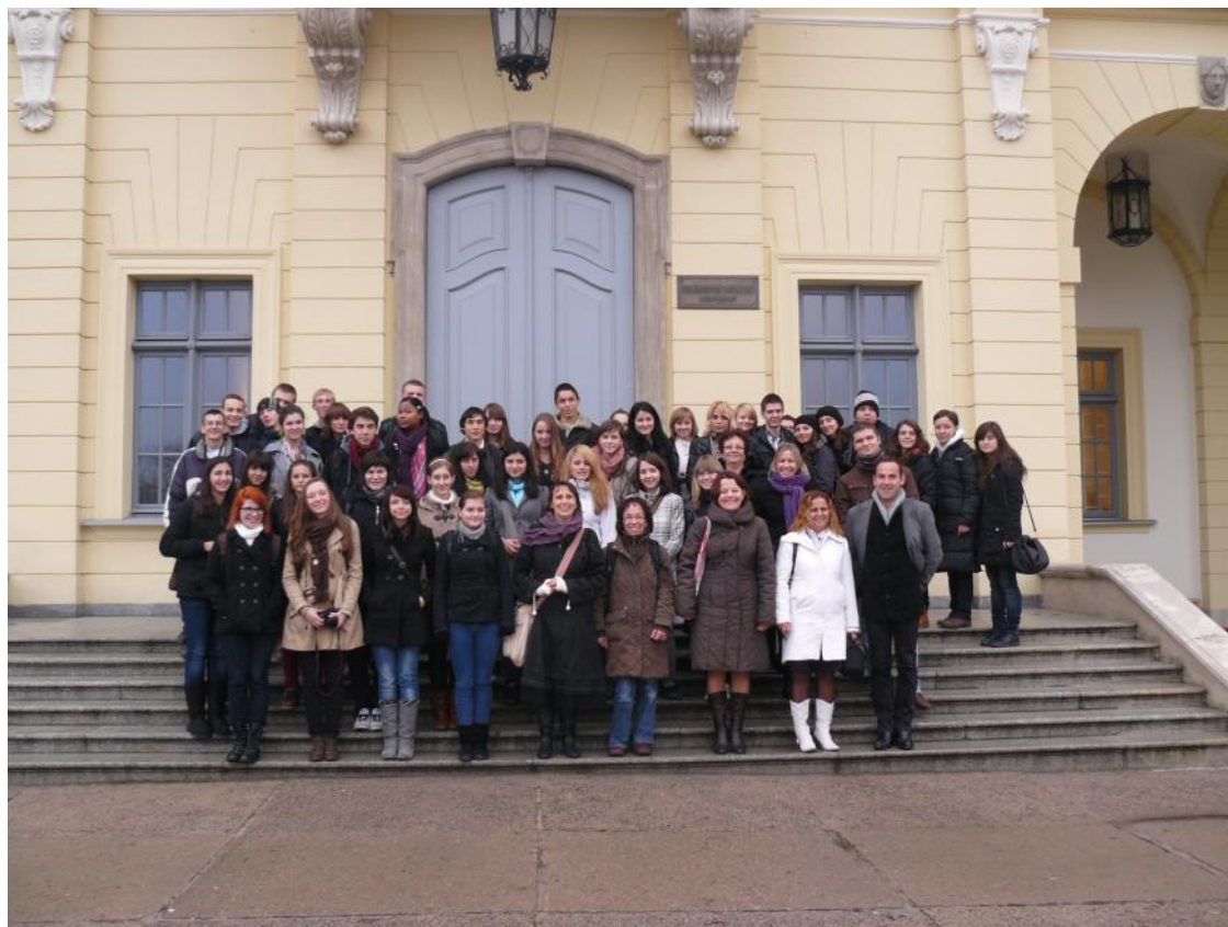
L'ensemble des participants en Pologne sur les marches de l'Académie de Médecine à Białystok

Maintenant, nous laissons la place aux autres élèves du groupe qui partiront en Roumanie au printemps prochain pour poursuivre le projet.