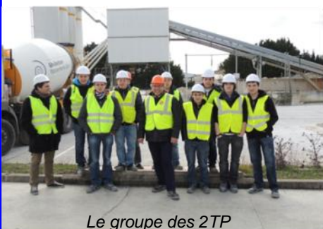
Le groupe des 2TP

Nous avons visité la centrale à béton Unibéton, il s'agit d'une centrale moderne de production de béton qui n'a qu'une dizaine d'années d'âge.