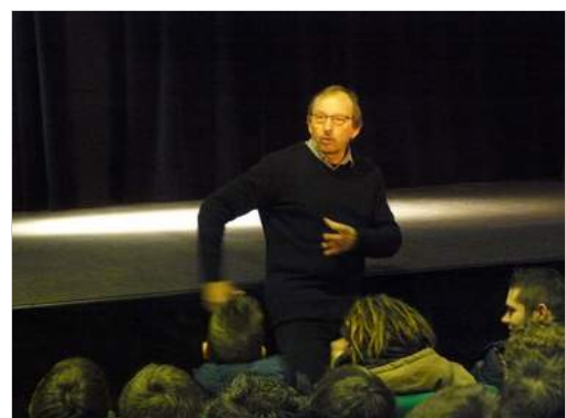
Didier Daeninckx dans la salle de spectacle

A l'issue de la rencontre, une séance de dédicace était organisée. Puis des élèves de 3 e Prépa Pro ont enregistré un entretien exclusif afin de le diffuser sur radio Pons.