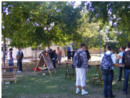
découverte de jeux traditionnels en bois

Dès les 2 et 3 septembre 2010 pour les sections professionnelles.