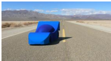
Prototype Equipe SPHERC

Depuis le début de l'année scolaire, 2 groupes de 2GT4 sont inscrits au concours national « Course en cours » dans le cadre d'un projet lié aux enseignements de CIT-SI. L'objectif est de dessiner et de concevoir une mini voiture de course propulsée par un moteur électrique. Ça décoiffe : 100 km/h sur 20m départ arrêté !!!