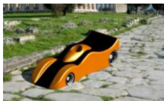
Prototype Equipe CYNDER

La fabrication des voitures sont en cours. Le projet englobe aussi la construction d'un stand et la recherche d'une tenue personnalisée pour chacune des équipes. A bientôt pour de nouvelles informations sur l'avancée des travaux.