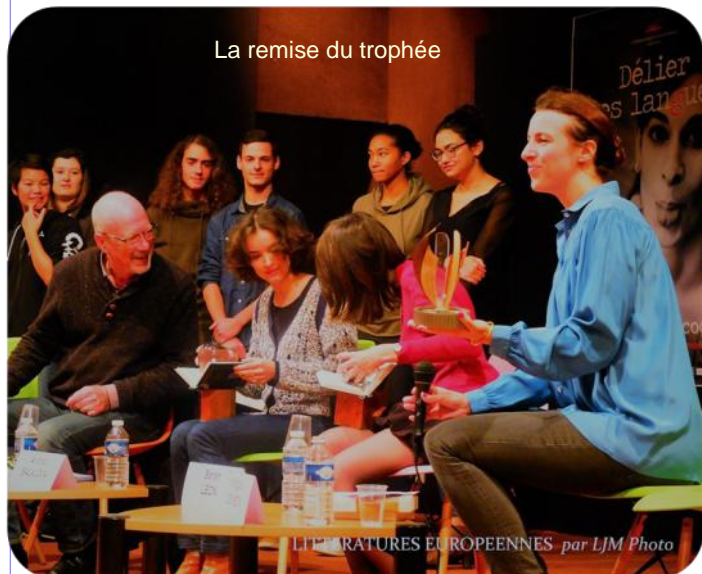
LITTÉRATURES EUROPÉENNES

lonais dont le titre est Ida et dont l'action se passe pendant les années 1960. Puis une rencontre avec des professionnels des métiers du livre (éditeurs, auteur, libraire) a été l'occasion d'un échange intéressant avec les élèves.